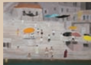
「印度スケッチ」 《永遠の街ベネニス 沐浴の人々》2004年

「印度スケッチ」を紹介する。2004年、永観堂釈迦堂の障壁画制作のため、インドをはじめ東南アジアの諸国へと取材旅行を行った際に制作されたのが同シリーズである。はじめて目にした異文化の光景への関口の新鮮な驚きと、畏敬の念とが溢れている。